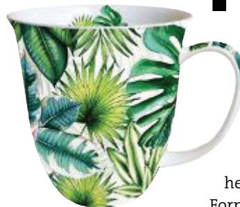
Tropenkaffee Der blattbedruckte Becher von Ambiente bringt Urlaubsfeeling auf den Tisch (10,90 Euro)

P almblätter wachsen auf Sofakissen, exotische Vögel zwitschern von der Tapete. Diniert wird auf farbenprächtigen Blüten, die Schalen und Teller zieren. Ob Möbel, Dekorationen oder Textilien, das tropische Paradies ist just allgegenwärtig. Kein Wunder, sagen Trendforscher, sind doch die unveränderbaren Abläufe der Natur ein Ruhepol in unserer hektischen Gesellschaft. Organische Formen, archaische Strukturen und