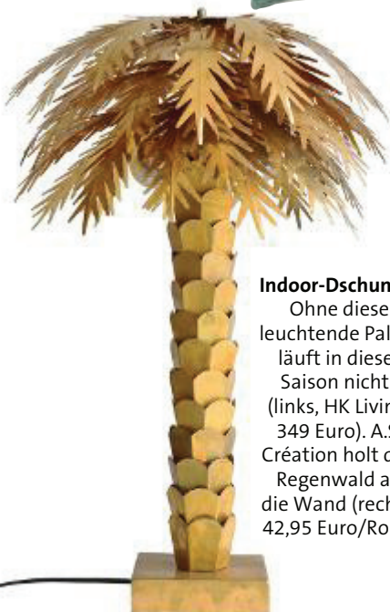
Indoor-Dschungel Ohne diese leuchtende Palme läuft in dieser Saison nichts (links, HK Living, 349 Euro). A.S. Création holt den Regenwald an die Wand (rechts, 42,95 Euro/Rolle)

P almblätter wachsen auf Sofakissen, exotische Vögel zwitschern von der Tapete. Diniert wird auf farbenprächtigen Blüten, die Schalen und Teller zieren. Ob Möbel, Dekorationen oder Textilien, das tropische Paradies ist just allgegenwärtig. Kein Wunder, sagen Trendforscher, sind doch die unveränderbaren Abläufe der Natur ein Ruhepol in unserer hektischen Gesellschaft. Organische Formen, archaische Strukturen und