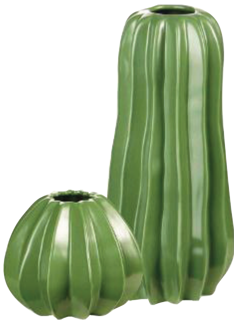
Stachelfrei In den Kakteen aus Keramik wirken selbst heimische Blumen gleich viel exotischer (ASA, ab 14,90 Euro)