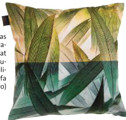
Blätterwald Das Tropical-Flora-Kissen von Kaat Amsterdam zaubert eine kuschelige Oase aufs Sofa (24,95 Euro)

alle Preisangaben unverbindlich