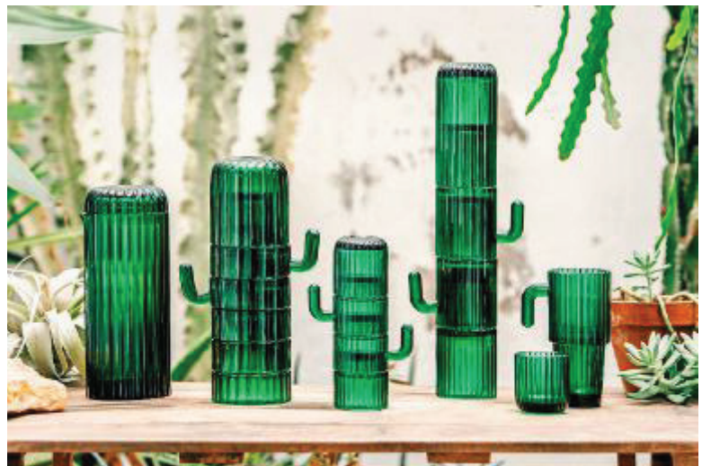
Becherturm Hoch gestapelt wandeln sich die Saguaro-Gläser von Doiy Design zum Kaktus (Vierer-Set, 34,95 Euro)

alle Preisangaben unverbindlich