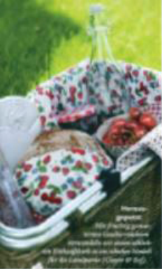
Wortwahl Ein Picknick ist eine kleine Mahlzeit im Freien die in einem Korb mit Essen und Trinken für eine Gruppe von Menschen ist.

Einen hübschen Kopf besonders aus Kirschen- gläsern oder Erdbeeren in Ölglasen genau der gleiche hat „Lyon“ Gault und Kachel enthalten haben (in einem roten Stoff gefast, Clips & Top)