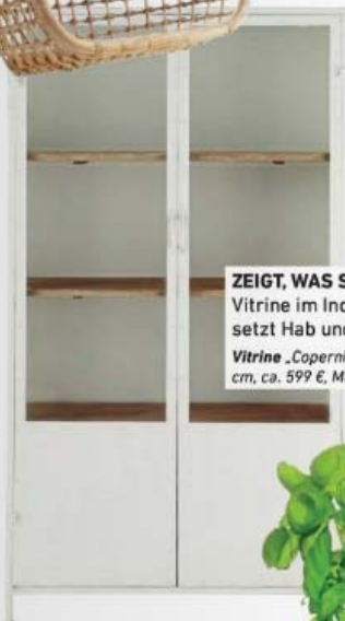
ZEIGT, WAS SIE HABEN Die Vitrine im Industriestil setzt Hab und Gut in Szene Vitrine „Copernic“ , 180 x 100 x 43 cm, ca. 599 €, Maisons du Monde