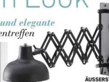
ÄUSSERST ENTGEGENKOMMEND Wenn die klassische Scherensleuchte Sendepause hat, schmiegt sie sich platzsparend an die Wand Wandleuchte „Triangel“ , ca. 28 x 26 x 60 x 17 cm, ca. 70 €, Fashion For Home