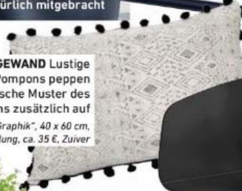
RANDGEWAND Lustige Pompons peppen das grafische Muster des Kissens zusätzlich auf Kissen „Graphik“ , 40 x 60 cm, inkl. Füllung, ca. 35 €, Zuiver