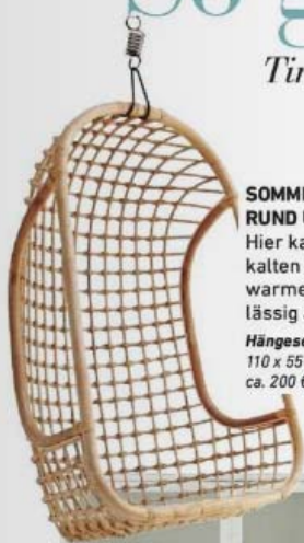
SOMMERFEELING RUND UMS JAHR Hier kann man an kalten und an warmen Tagen lässig abhängen Hängesessel , 110 x 55 x 72 cm, ca. 200 €, Lef Living

Tinne lässt Objekte mit Geschichte und elegante Elemente harmonisch zusammentreffen