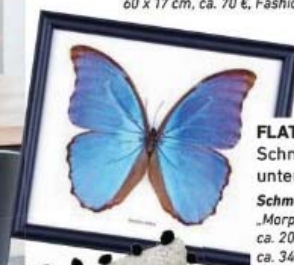
FLATTERHAFT Schmetterling unter Glas Schmetterling „Morpho didius“ , ca. 20 x 25 x 3 cm, ca. 34 €, Natural History Curiosities über Amazon