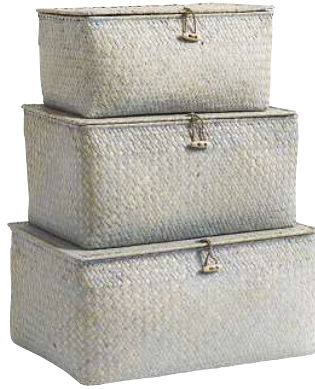
1-2-3, VERSTECKT Die Körbe aus Peddigrohr mit Knebelverschluss sind gute Ordnungskomplizen (ca. 30 Euro, Nordal ).