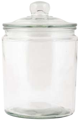
GLASKLAR Schöne Aufbewahrung für Nudeln, Linsen und Co. (ab ca. 6 Euro, Ib Laursen über Car Möbel ).

Der Kochraum wird erst durch die passenden Accessoires so richtig praktisch – und lebendig.