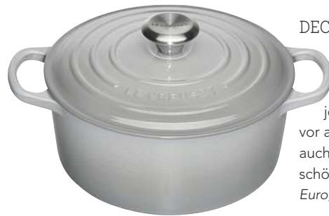
DECKEL DRAUF Ein Topf aus Gusseisen gehört in jede Küche, vor allem wenn er auch noch so schön ist (ca. 130 Euro, Le Creuset ).