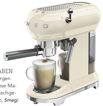
MUSS MAN HABEN Was wäre ein Morgen ohne Kaffee – diese Maschine braut ihn fachgerecht (ca. 350 Euro, Smeg ).