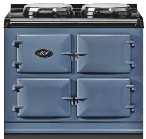
EIN ECHTER KLASSIKER Der Herd macht sich nicht nur in einer Landhausküche prima (Preis auf Anfrage, Aga ).

GEWÜRZE sollten lichtgeschützt neben dem Herd stehen (Küche von Team 7).