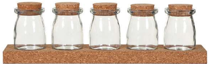
REIH UND GLIED Die Korke schützen den Inhalt (ca. 14 Euro, Garden Trading ).