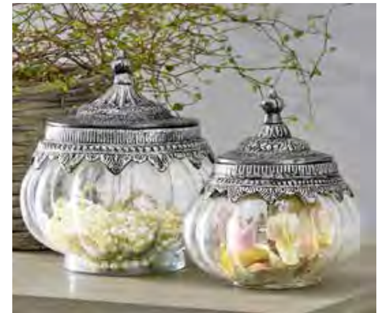
Sie bewahren Schmuck und Blütendeko formschön und dekorativ. Besonders raffiniert sind die kunstvoll verzierten Deckel der beiden Glasdosen „Madelon“. Im 2er-Set, von Loberon, ca. 29 Euro