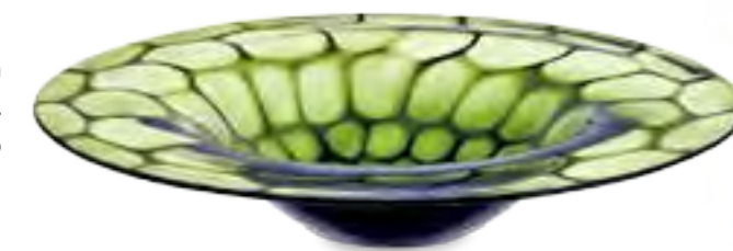
Organische Muster in leuchtendem Grünton prägen die Schale „Galea“. Von Leonardo, für ca. 36 Euro