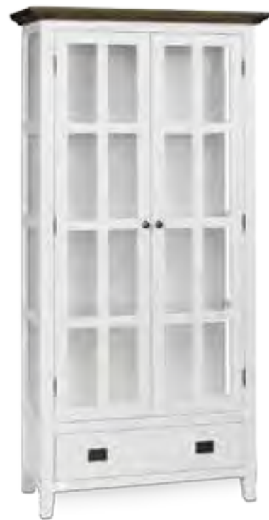
In der großen, weißen Vitrine „Nottingham“ kommen allerlei schöne Dinge bestens zur Geltung. Über WestwingNow für ca. 959 Euro