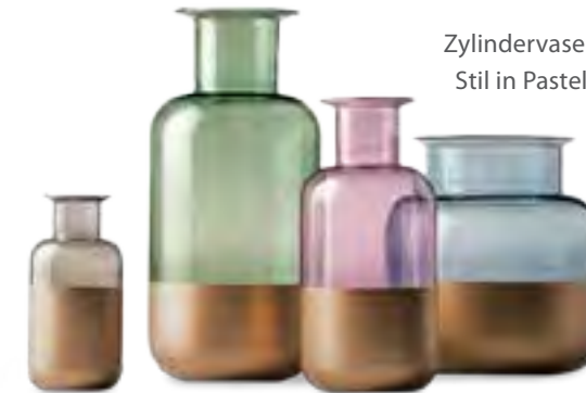
Zylindervasen im nordischen Stil in Pastell mit halboberer Lackierung, von Livø, ab ca. 29 Euro