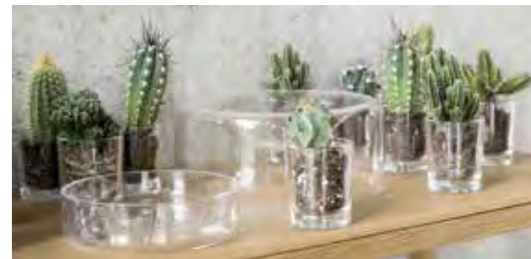
Versteckt zwischen Kakteen präsentiert sich die Schale „Jar“ einmal flach und einmal mit tiefer Wölbung. Von Schönbuch über connox, ca. 55 Euro