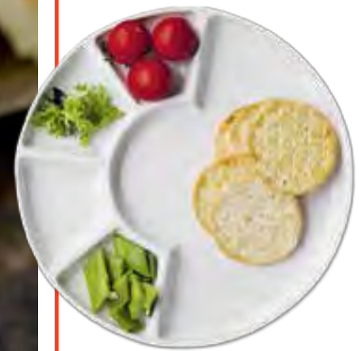
Kein Soßen-Mischmasch mehr: Der Fondueteller „Tapero“ trennt sauber Dips und Beilagen sowie Rohes von schon Gegartem. Teller ca. 15 Euro, von ASA