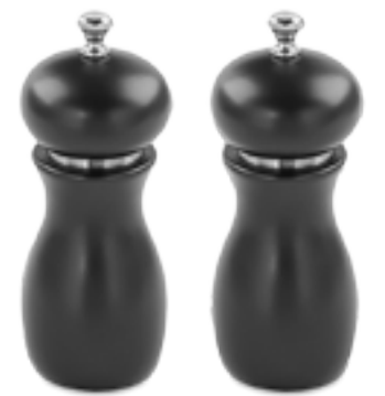
Für die richtige Würze sorgen Salz- und Pfeffermühle „Mulino“ mit Keramikmahlwerk. Das Set kostet ca. 70 Euro, von Fink