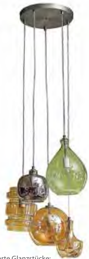
Zarte Glanzstücke: Die durchscheinenden Lampen zaubern zartes Licht in abgestimmten Farbnuancen. „Brooklyn“-Pendelleuchte von Home24, für ca. 190 Euro