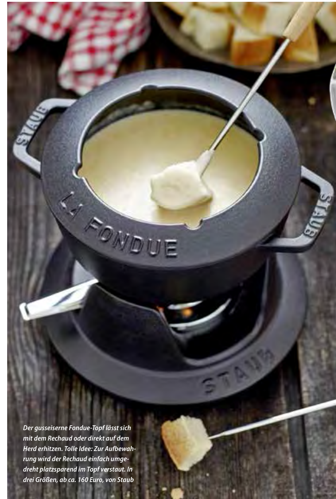
Der gusseiserne Fondue-Topf lässt sich mit dem Rechaud oder direkt auf dem Herd erhitzen. Tolle Idee: Zur Aufbewahrung wird der Rechaud einfach umgedreht platzsparend im Topf verstaut. In drei Größen, ab ca. 160 Euro, von Staub