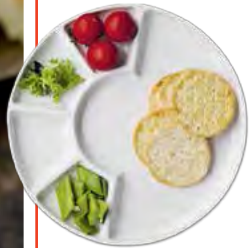
Kein Soßen-Mischmasch mehr: Der Fondueteller „Tapero“ trennt sauber Dips und Beilagen sowie Rohes von schon Gegartem. Teller ca. 15 Euro, von ASA