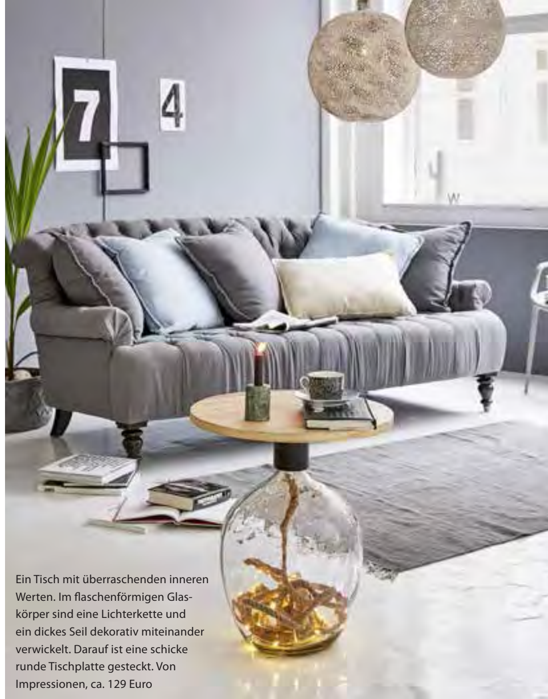
Ein Tisch mit überraschenden inneren Werten. Im flaschenförmigen Glaskörper sind eine Lichterkette und ein dickes Seil dekorativ miteinander verwickelt. Darauf ist eine schicke runde Tischplatte gesteckt. Von Impressionen, ca. 129 Euro