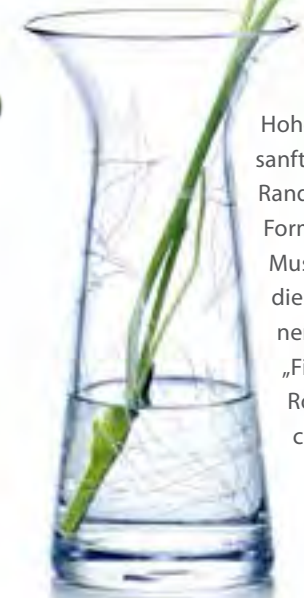
Hoher Hals und sanft gebogener Rand – ihre schlichte Form mit zarten Mustern zeichnen diese durchscheinende Vase aus. „Filigran“, von Rosendahl, für ca. 45 Euro

FOTOS: HERSTELLER, TEXT: KIRSTEN FEHRENBACH