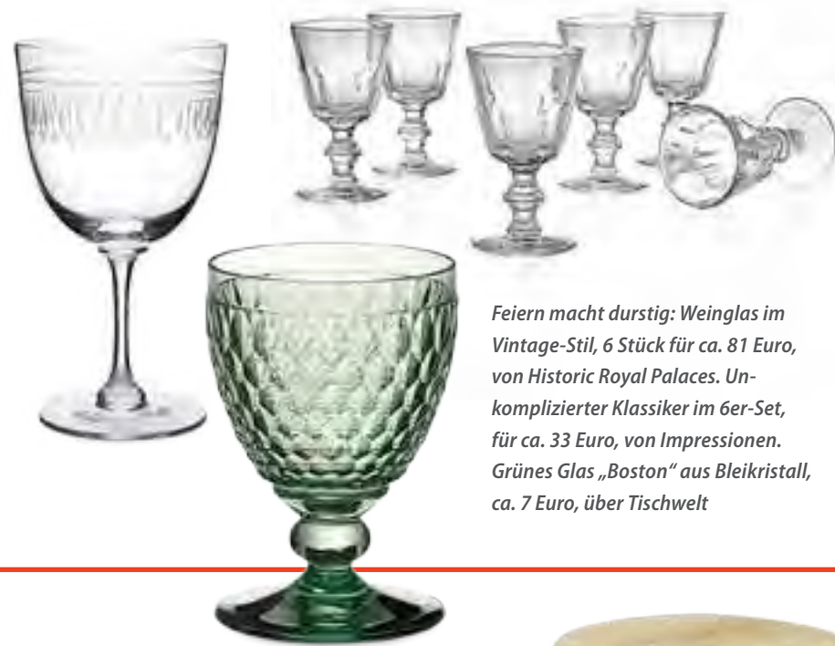
Feiern macht durstig: Weinglas im Vintage-Stil, 6 Stück für ca. 81 Euro, von Historic Royal Palaces. Unkomplizierter Klassiker im 6er-Set, für ca. 33 Euro, von Impressionen. Grünes Glas „Boston“ aus Bleikristall, ca. 7 Euro, über Tischwelt

Platzsparender Hochstapler für Snacks, Dips und Beilagen. Aus Akazienholz und Porzellan, für ca. 46 Euro, von Villeroy & Boch