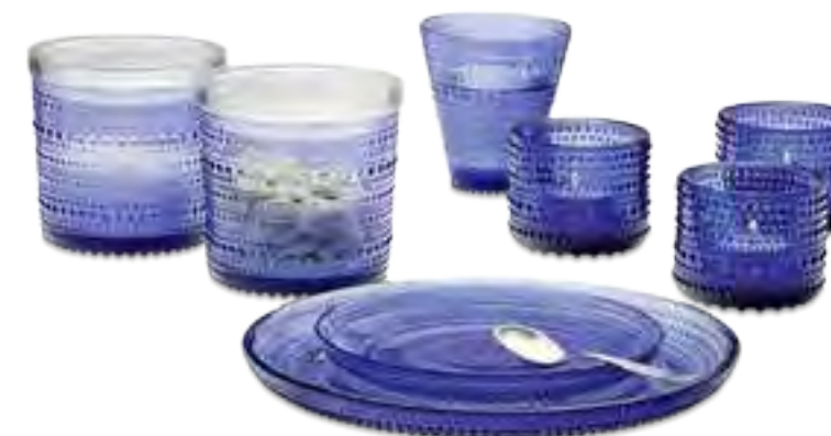
Die finnischen Designklassiker der Serie „Kastehelmi“ gibt es zurzeit in der Farbe Ultramarin. Von Iittala, ab ca. 15 Euro