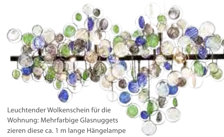
Leuchtender Wolkenschein für die Wohnung: Mehrfarbige Glasnuggets zieren diese ca. 1 m lange Hängelampe „Clouds Colore“, von Kare, ca. 1080 Euro