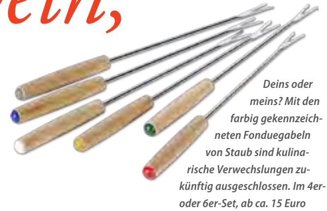
Deins oder meins? Mit den farbig gekennzeichneten Fonduegabeln von Staub sind kulinarische Verwechslungen zukünftig ausgeschlossen. Im 4er- oder 6er-Set, ab ca. 15 Euro

Ein Käsefondue gehört zum Winter wie Kaminfeuer und ist das perfekte Essen für Familie und Freunde an kalten Tagen. Käse, Wein, Brotwürfel, und natürlich schöne Tischdeko – mehr braucht es nicht für gemütliche Runden zur Winterzeit.