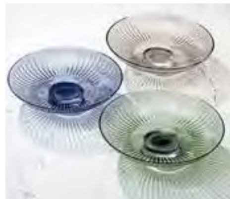
Die „Signum“-Schalen glänzen mit ihrem ausgefallenen Schliff. Im Lichtschein entstehen sehr hübsche Schattenspiele. Von Zwiesel Kristallglas für ca. 229 Euro

Glas verzaubert immer wieder aufs Neue durch sein Spiel aus filigranen Farben und Formen. Dünn, durchscheinend, gefärbt oder gemustert – seiner Form sind kaum Grenzen gesetzt.