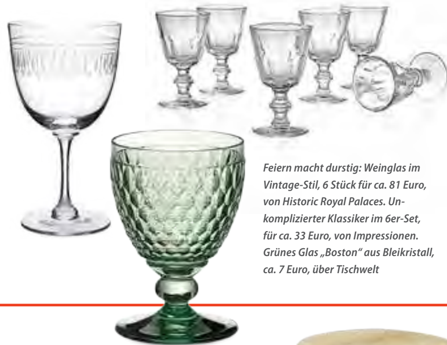
Feiern macht durstig: Weinglas im Vintage-Stil, 6 Stück für ca. 81 Euro, von Historic Royal Palaces. Unkomplizierter Klassiker im 6er-Set, für ca. 33 Euro, von Impressionen. Grünes Glas „Boston“ aus Bleikristall, ca. 7 Euro, über Tischwelt

Platzsparender Hochstapler für Snacks, Dips und Beilagen. Aus Akazienholz und Porzellan, für ca. 46 Euro, von Villeroy & Boch