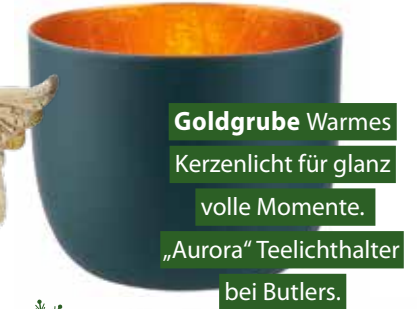
Goldgrube Warmes Kerzenlicht für glanzvolle Momente. „Aurora“ Teelichthalter bei Butlers.