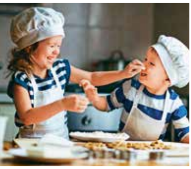
Weihnachtsbäckerei: Mit der Familie backen & genießen

*** Extra: Großes Preisrätsel mit Gewinn ***