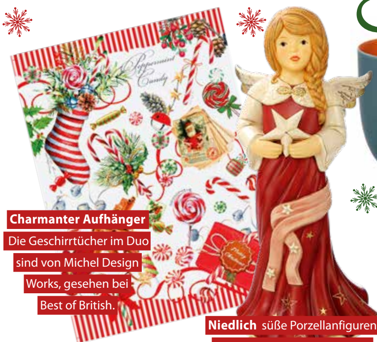
Charmanter Aufhänger Die Geschirrtücher im Duo sind von Michel Design Works, gesehen bei Best of British.