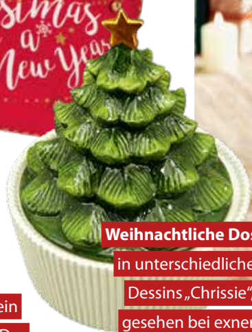
Weihnachtliche Dosen in unterschiedlichen Dessins „Chrissie“, gesehen bei exner-collection.de.