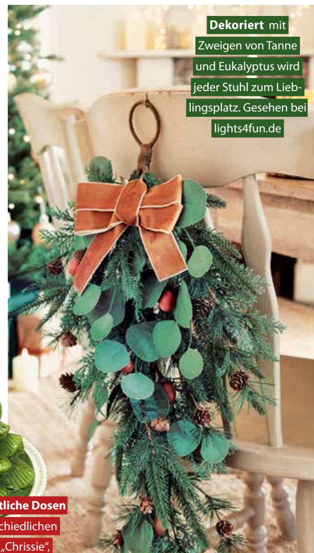
Dekoriert mit Zweigen von Tanne und Eukalyptus wird jeder Stuhl zum Lieblingsplatz. Gesehen bei lights4fun.de