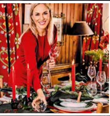
So festlich! Inspirationen für den gedeckten Tisch