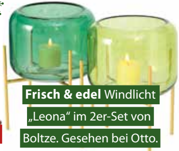
Frisch & edel Windlicht „Leona“ im 2er-Set von Boltze. Gesehen bei Otto.