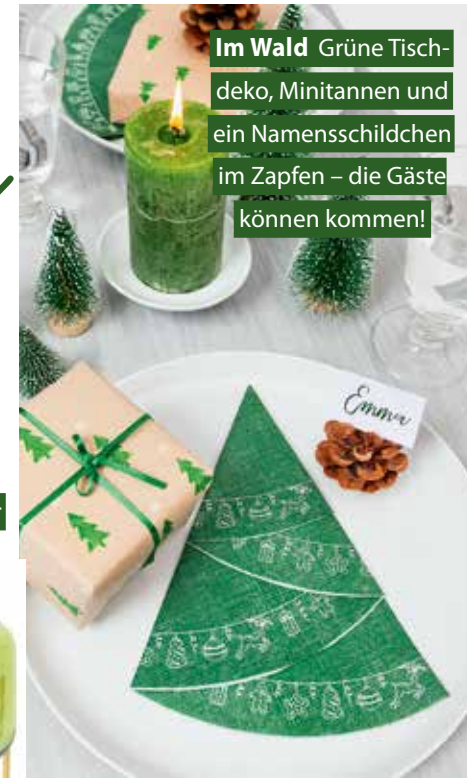
Im Wald Grüne Tischdeko, Minitannen und ein Namensschildchen im Zapfen – die Gäste können kommen!