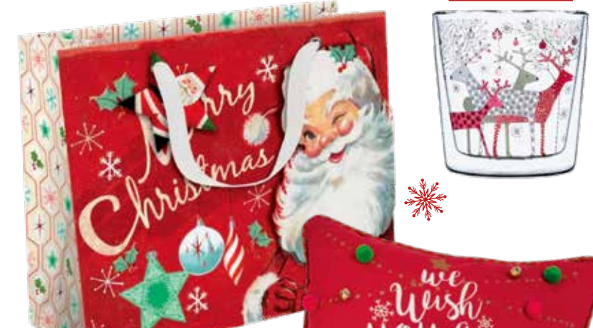
Skandinavisch Trinkglas mit Rentiermotiv