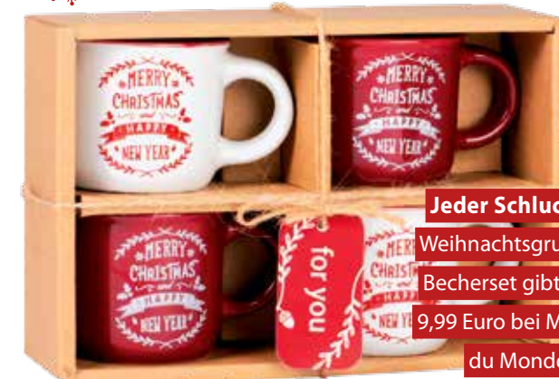
Jeder Schluck ein Weihnachtsgruß. Das Becherset gibt es für 9,99 Euro bei Maisons du Monde.