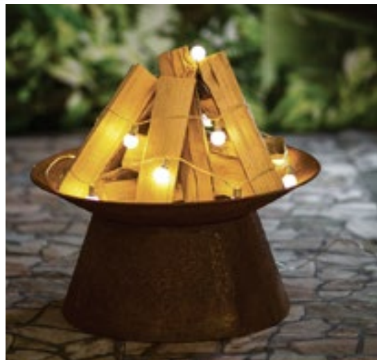
Links: In der Feuerschale aus Eisen darf eine Leuchtkette für warmes Licht sorgen, von Depot, ca. 30 Euro. Rechts: „Partyschirmchen“ am laufenden Band – die bunte Lichterkette gibt's von Pink Dots für ca. 20 Euro