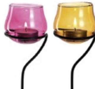
Bunte, bauchige Balkonlichter mit praktischen Einsteckern sorgen für farbige Lichtreflexe. Aus der Serie „Giardino“ von Leonardo, ca. 9 Euro