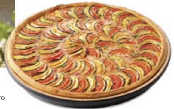
Die Schale aus Ton darf auf den Grill und in ihr gelingen leckere Tartes. Von Römertopf aus der Johann-Lafer-BBQ-Serie, ca. 40 Euro