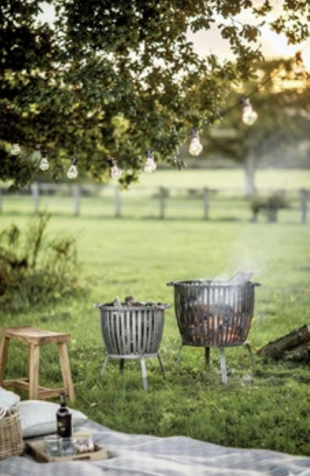
Groß und Klein gesellt sich gern – die beiden Feuerkörbe fassen viel Holz für stimmungsvolle Gartenfeste. „Barrington“ von Garden Trading für ca. 114 Euro